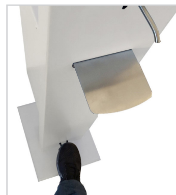
Commande au pied

Commande non annulable. Le traitement de vos demandes et les délais de livraison peuvent être allongés. Merci pour votre compréhension.