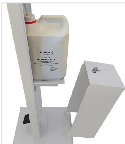
Grande autonomie avec bidon de 5 L