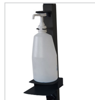
Compatible 1 L

Commande non annulable. Le traitement de vos demandes et les délais de livraison peuvent être allongés. Merci pour votre compréhension.