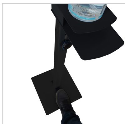
Commande au pied